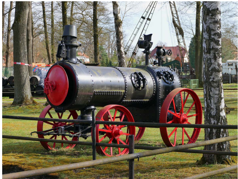
Exponate auf dem Freigelände des Deutschen Erdölmuseums

Übrigens: Mit einer Ausnahme können die Vortragstexte des Kolloquiums im jetzt erschienenen Heft 10 der NIN-Reihe „Netzwerk Industriekultur“ nachgelesen werden. (Martin Stöber)