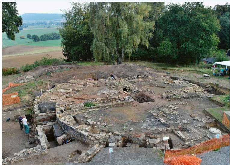
Abschlussbericht über die Grabung in Klein Süntel