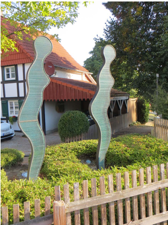
„Wegbegleiterinnen“ von Bernd Wiegand

https://de.wikipedia.org/wiki/Forum_Glas