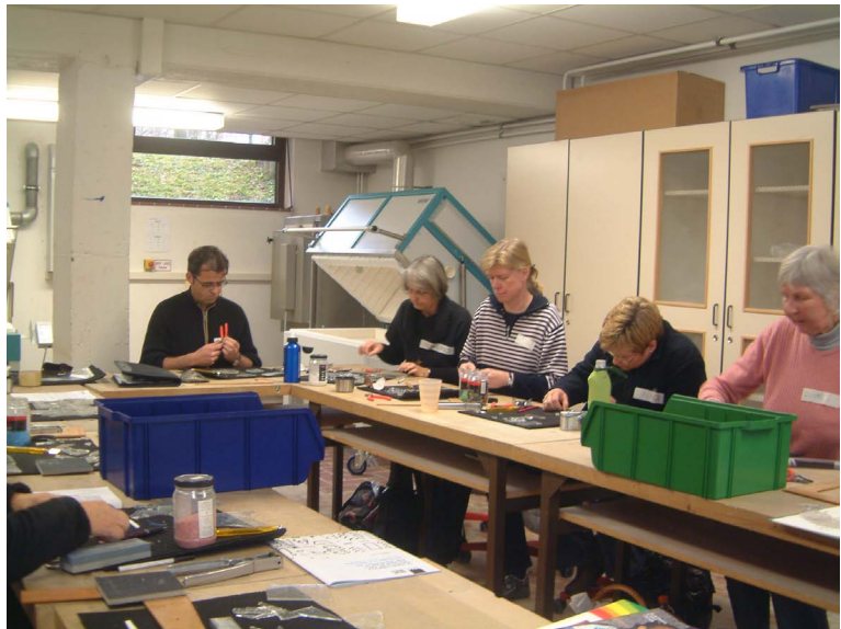
Glasfusingkurs – im Hintergrund ein Glasfusingofen

Genau hier engagiert sich das Forum Glas. Der Verein erforscht und dokumentiert die Geschichte der Glasherstellung in der Deister-Süntel-Osterwald-Region, vermittelt traditionelle und moderne Techniken der Glasgestaltung, organisiert Ausstellungen und Exkursionen und setzt mit Glaskunstwerken sichtbare Akzente im Stadtbild von Bad Münde.