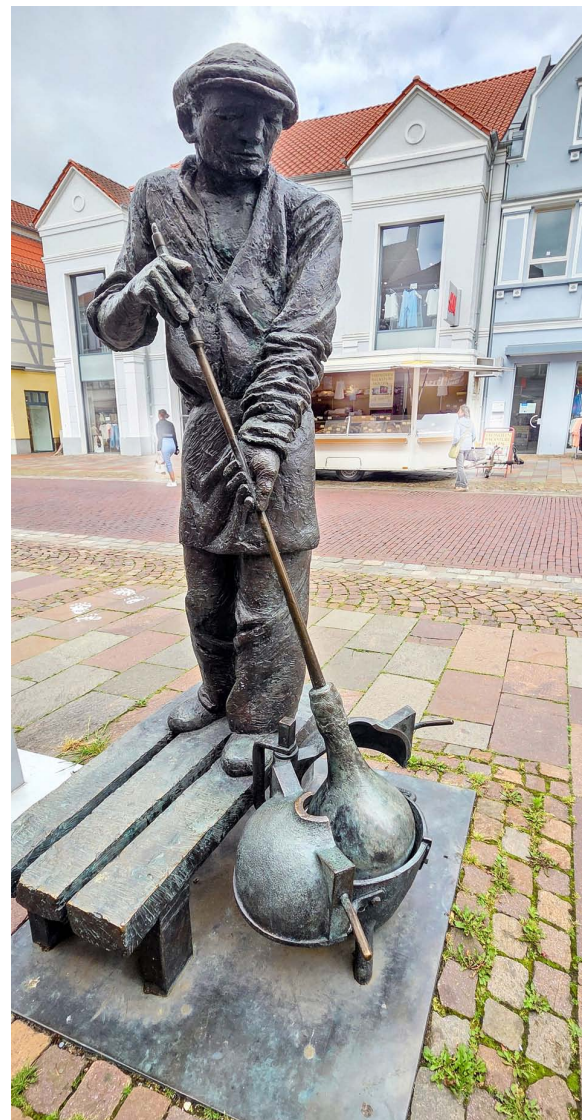
„Glasmacher“ – Skulptur in Nienburg, Kurt Tassotti, 1989.

Und das mit der Statistik und der „Nummer 1“ ist solch' eine Sache. Es stimmt: Niedersachsen ist der Schiffbaustandort Nr. 1 in Deutschland – übrigens eine Industrie. Das mit der Landwirtschaft ist schwieriger: In seiner Stellungnahme zur Imagekampagne meint der Lobbyverband „Niedersachsen-Metall“: Das Land bliebe „als Wirtschafts- und Industriestandort in der öffentlichen Wahrnehmung bislang deutlich unter seinen Möglichkeiten. Zu wenige Menschen verbinden unser Land mit wirt-