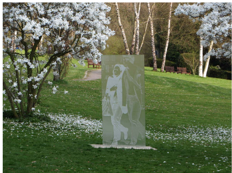
Skulptur „Antiphon“ von Thierry Boissel

Ein weiterer Meilenstein war die große Glaskunstausstellung im Jahr 2019. Gemeinsam mit der Stadt Bad Münde und der GeTour GmbH präsentierte